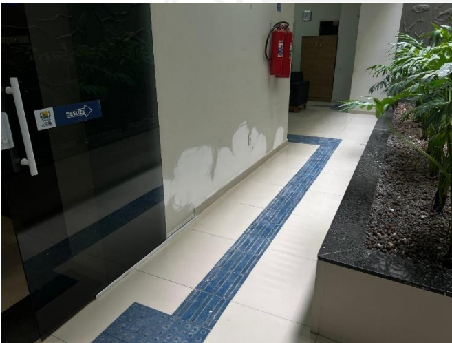
Fotos 05 a 11: Paredes com infiltrações, eflorescências e pinturas danificadas: